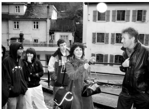
L'Institut neuchâtelois nous fait découvrir les richesses de la rue de l'Hôtel-de-Ville à La Chaux-de-Fonds