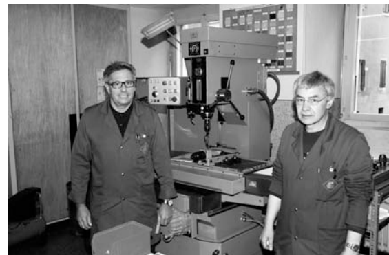
Les maîtres d'atelier et la nouvelle perceuse